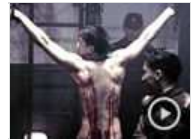
甄子丹裸身大秀阴柔