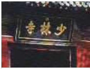
少林寺不可能上市