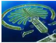
温州炒房客转赴三亚