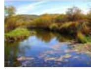
黑龙江大片湿地被偷垦