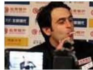
奥沙利文发布会吸烟