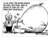
越南印度出现严重通胀