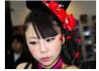
日本车模和风姐有一拼