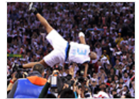
北京体育局助金隅夺冠