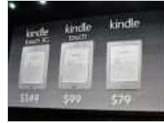
亚马逊发首款平板电脑