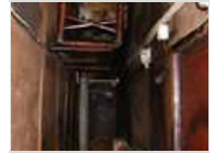
劳民伤财的面子工程