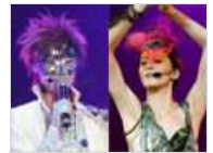
明星演唱会超囧造型